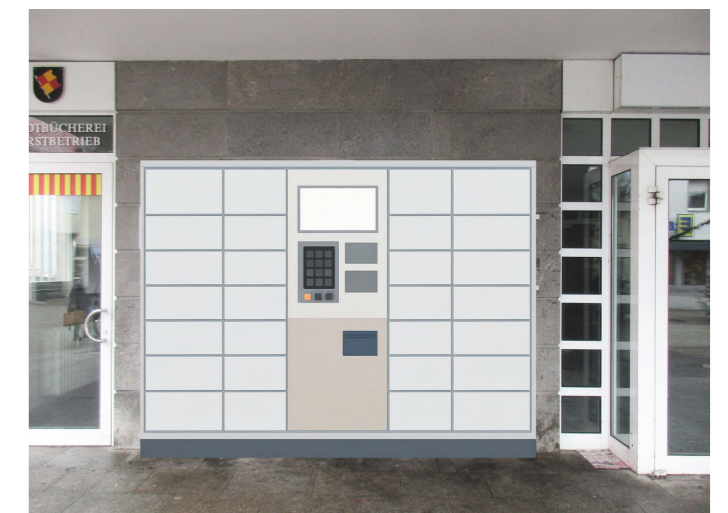
Standort des Abholschranks ab dem Frühsommer 2026